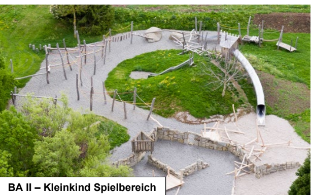
BA II - Kleinkind Spielbereich