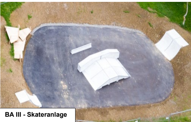
BA III - Skateranlage