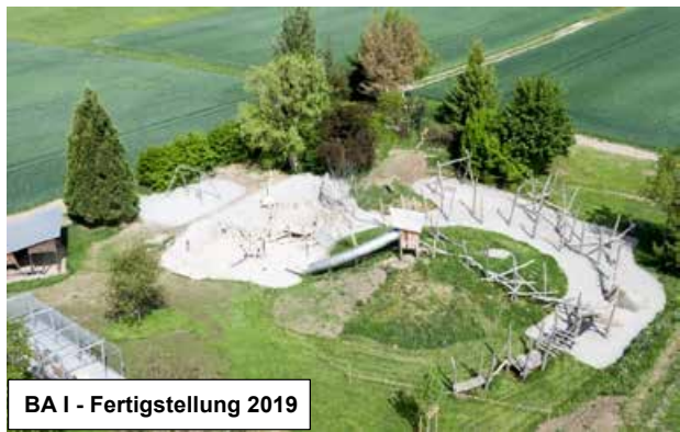
BA I - Fertigstellung 2019