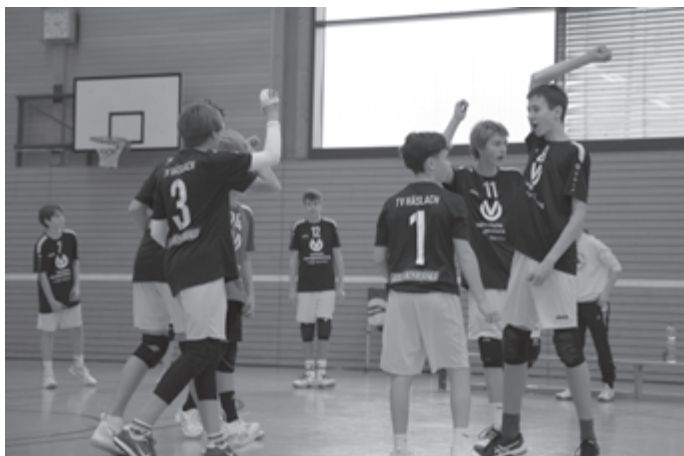
Gemeinsam Spaß beim Volleyball haben und Erfolge feiern.